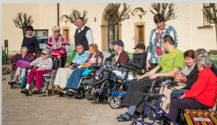
Klienti si nenechali setkání ujít.