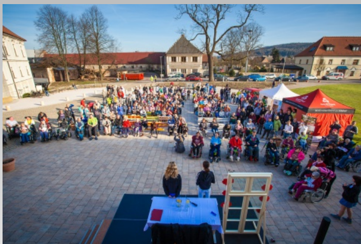
Do areálu Domova sv. Josefa dorazilo kolem tří set lidí.