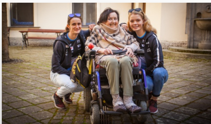
Jedna z nových majitelek vydražené bundy Martiny Sáblíkové.