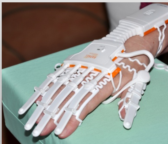
Chytrá rukavice - nový pomocník na rehabilitačním oddělení.

Díky finančnímu daru firmy Moneta money bank a.s. jsme mohli pořídit dva senzory pro opuštění lůžka. Využijeme je především u pacientů se ztíženými komunikačními možnostmi. Pomůže ale i se zjištěním a urychlením poskytnutí pomoci při epileptických záchvatech. Plochá snímací podložka senzoru totiž i přes silnou matraci dokáže zachytit ten nejnepatrnější pohyb, jako je tlukot srdce či dýchání a v případě odchylky upozorní ošetřující personál.