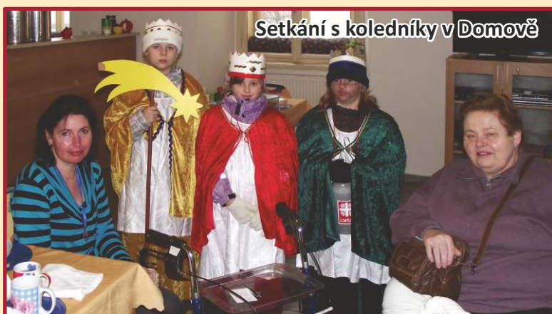
Setkání s koledníky v Domově