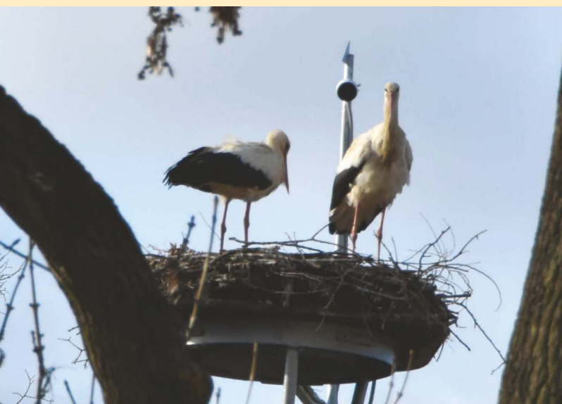
Pepa s Pepinou jsou konečně doma! Sledujte na YouTube DSJ