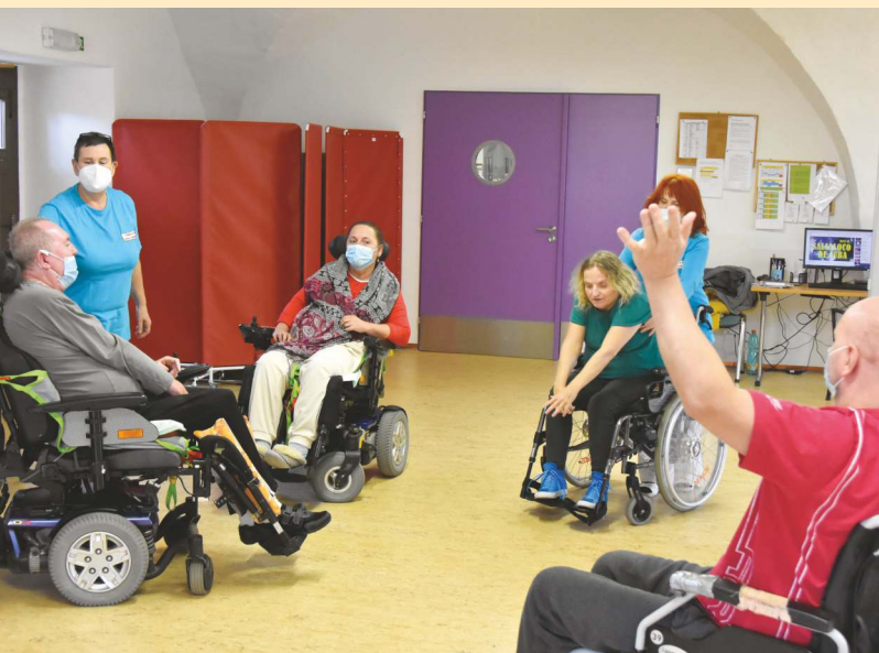
MaRS nebyl jen o cvičení, ale i o tanci na vozíku