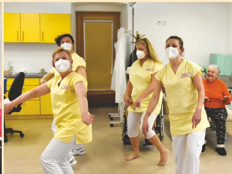
Jerusalema Dance Challenge – nácvik pod dohledem klientů