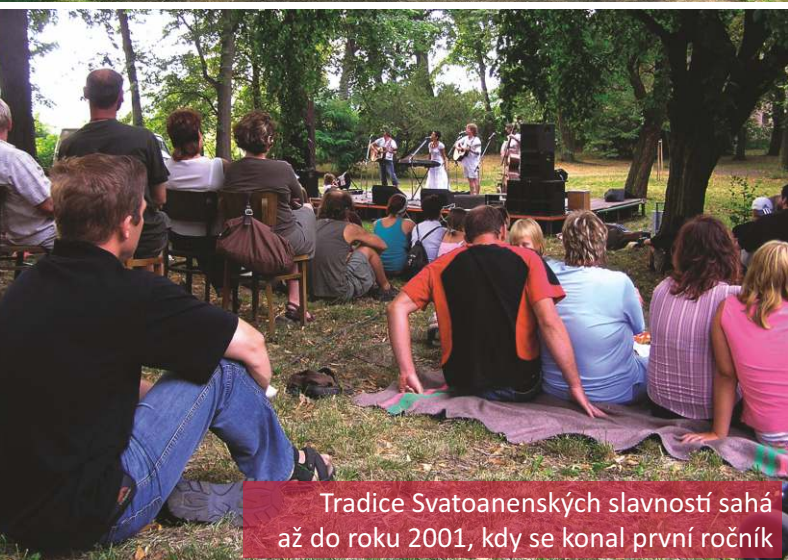
Tradice Svatoanenských slavností sahá až do roku 2001, kdy se konal první ročník