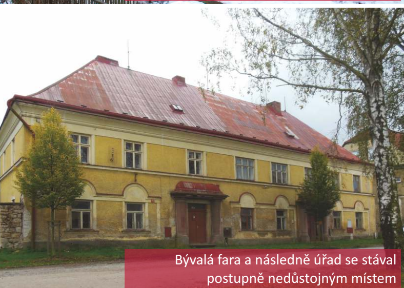
Bývalá fara a následně úřad se stával postupně nedůstojným místem