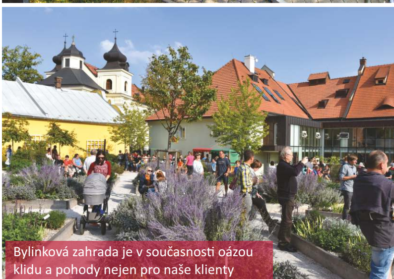
Bylinková zahrada je v současnosti oázou klidu a pohody nejen pro naše klienty