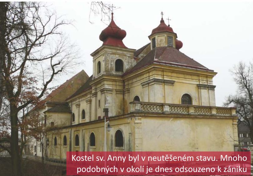
Kostel sv. Anny byl v neutěšeném stavu. Mnoho podobných v okolí je dnes odsouzeno k zániku

Má hvězda na nebi září, tak ať ještě dlouho se jí daří. Svítil ještě nezhasíná, ani mé srdce doposud neumírá. Bojím se tmy jako čert kříže, bojím se i na duši tíže. Bojím se zlého člověka, tomu co světlo svítí jen jednou do roka. Bojím se zlé lásky, co z ní dělají se krásky. Tak Hvězdo má mě opatruj, nikdy víc mně nezrazuj.