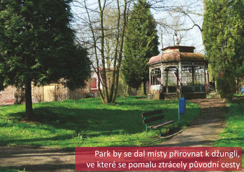
Park by se dal místy přirovnat k džungli, ve které se pomalu ztrácely původní cesty