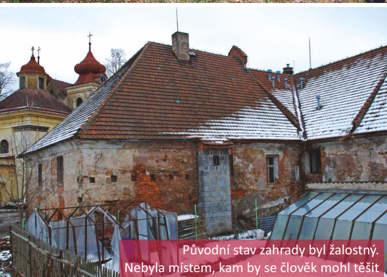
Původní stav zahrady byl žalostný. Nebyla místem, kam by se člověk mohl těšit