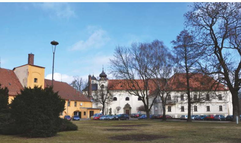
Náměstí bylo původně jedno velké bahnité parkoviště

Neváhejte a přijďte, těšíme se na osobní setkání s vámi.