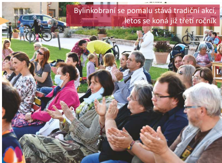
Bylinkobraní se pomalu stává tradiční akcí, letos se koná již třetí ročník

Cena za všechny kotle se pohybuje okolo 460 000 Kč. Chystáme se žádat o dotace ale podobně jako v minulých letech nám bude chybět spolufinancování. Výtěžek z toho to bulletinu poputuje kromě provozu a rozvoje na dofinancování nových kotlů. Podpořte prosím tento záměr, aby nemocným roztroušenou sklerózou nebyla zima. Děkujeme.