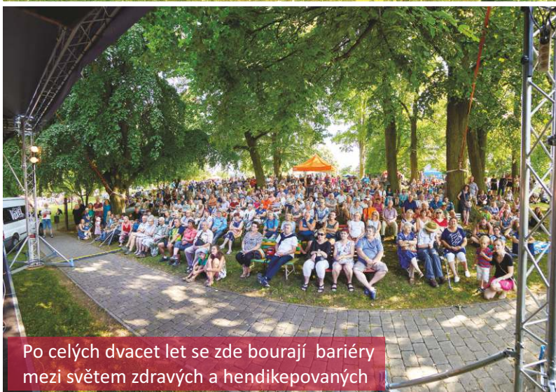
Po celých dvacet let se zde bourají bariéry mezi světem zdravých a hendikepovaných