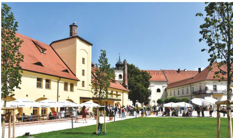
Po našem zásahu se z něj stalo příjemné místo setkávání zdravých a nemocných