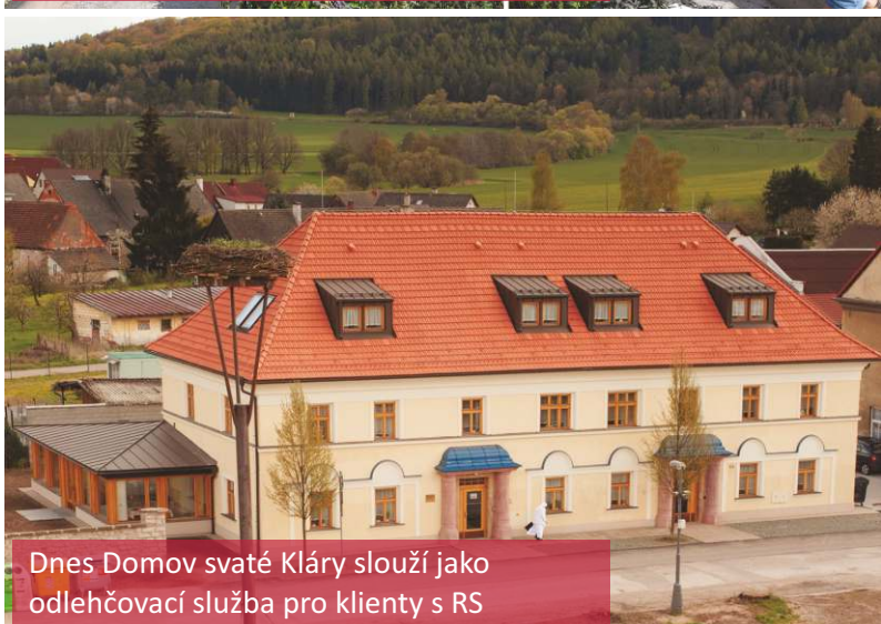
Dnes Domov svatě Kláry slouží jako odlehčovací služba pro klienty s RS