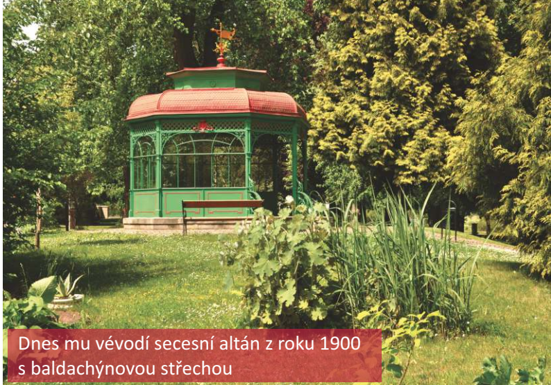
Dnes mu vévodí secesní altán z roku 1900 s baldachýnovou střechou