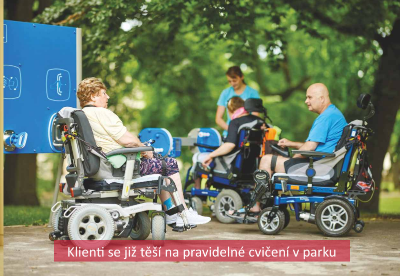
Klienti se již těší na pravidelné cvičení v parku