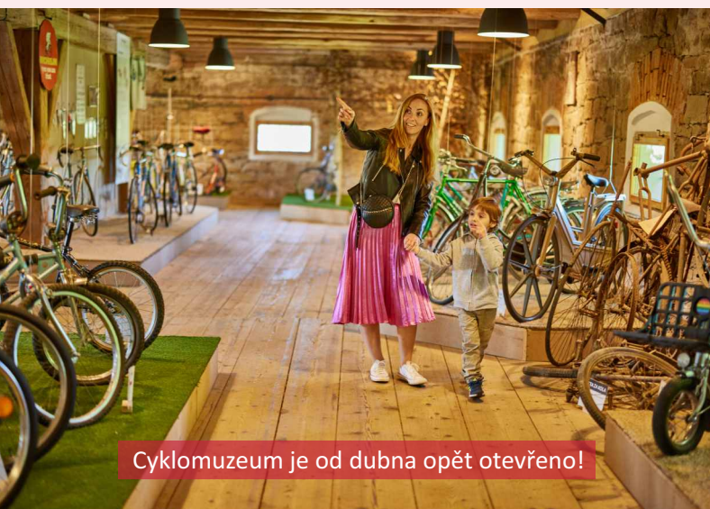
Cyklomuzeum je od dubna opět otevřeno!