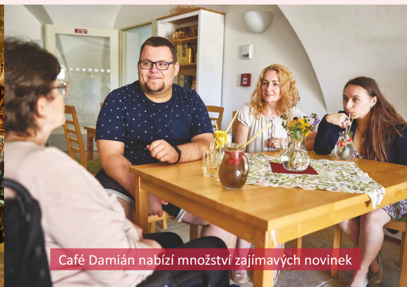
Café Damián nabízí množství zajímavých novinek