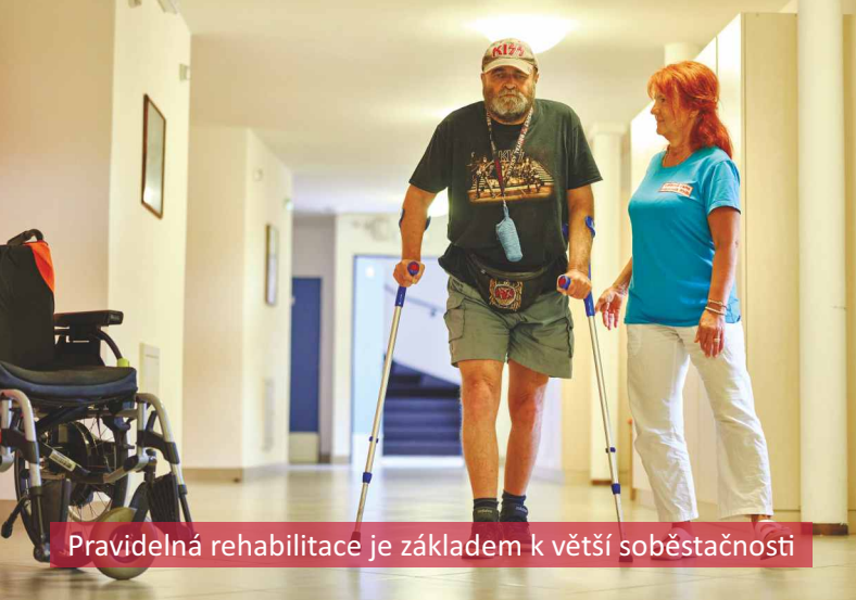
Pravidelná rehabilitace je základem k větší soběstačnosti