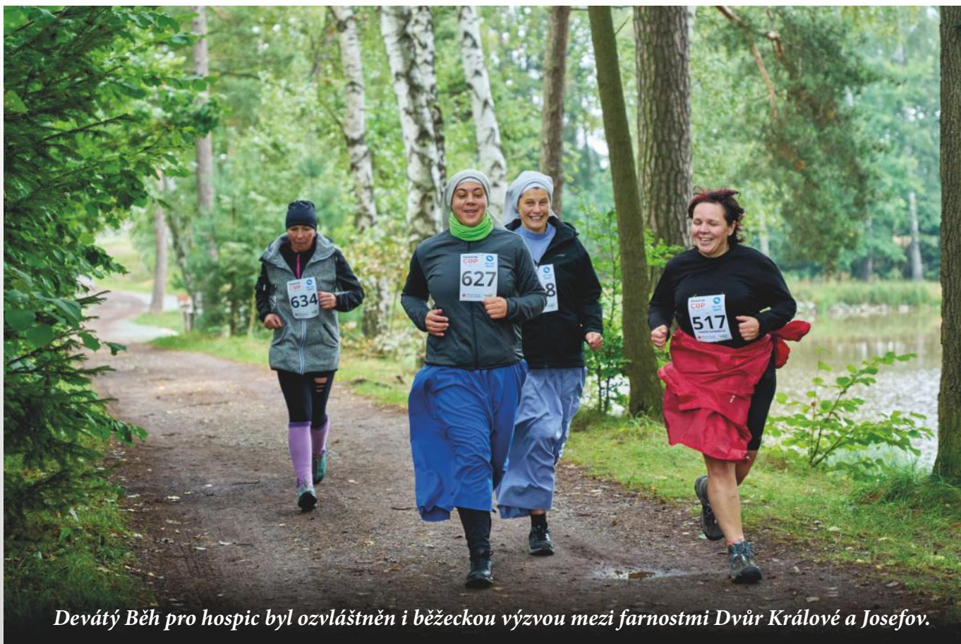
Devátý Běh pro hospic byl ozvláštněn i běžeckou výzvou mezi farnostmi Dvůr Králové a Josefov.

Součástí myšlenky hospicového hnutí bylo vždy zajišťovat i osvětovou činnost o smyslu a významu paliativní péče. V říjnu vyrazily naše zdravotní sestry z Mobilního hospice Anežky České na střední školu Academia Mercurii v Náchodě na besedu s tamními žáky. Podobně jako u mnoha nemocí, se kterými se člověk může v životě setkat, i u hospicové péče platí, že čím dříve se podaří umírajícímu pacientovi zajistit paliativní léčbu, tím lépe. Třebaže na krátký čas, hospic dokáže zvýšit kvalitu života umírajícího pacienta a poskytnout podporu jeho blízkým, aby své poslední chvíle mohli strávit bez obtíží, které provází těžká nemoc. Považujeme proto za velmi důležité s naší službou seznamovat už lidi v mladém věku. Ve spolupráci se školami se proto chystáme i na další besedy.