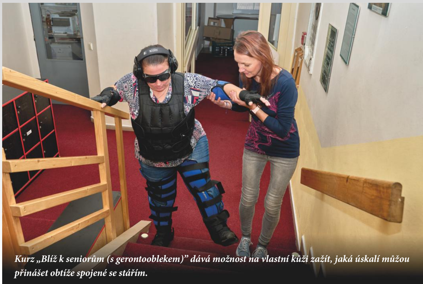
Kurz „Blíž k seniorům (s gerontoobletem)” dává možnost na vlastní kůži zažít, jaká úskalí můžou přinášet obtíže spojené se stářím.