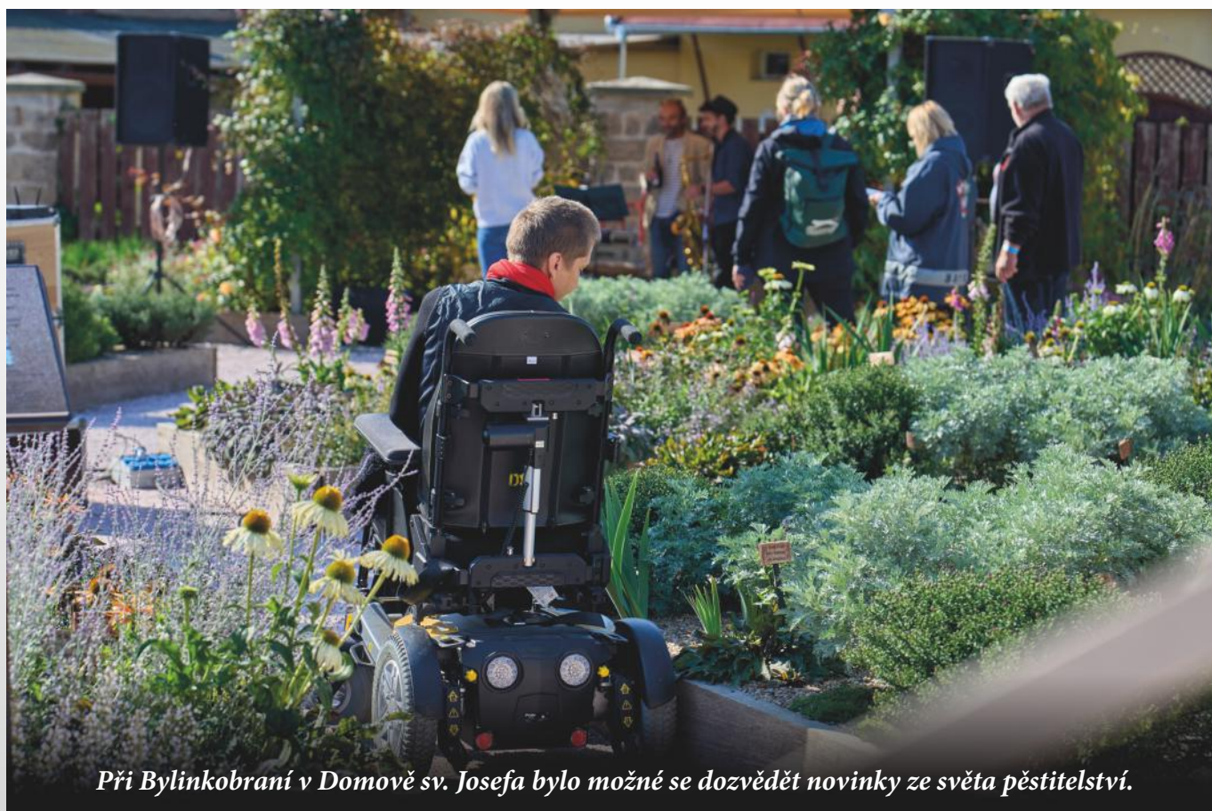
Při Bylinkobraní v Domově sv. Josefa bylo možné se dozvědět novinky ze světa pěstitelství.