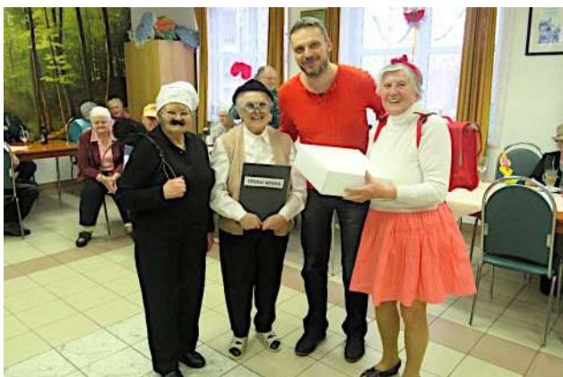
Karneval klientů charitní pečovatelské služby