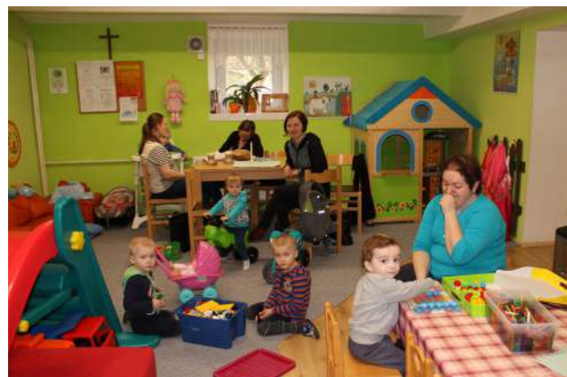
Mateřské centrum Veselý domeček v Háčku