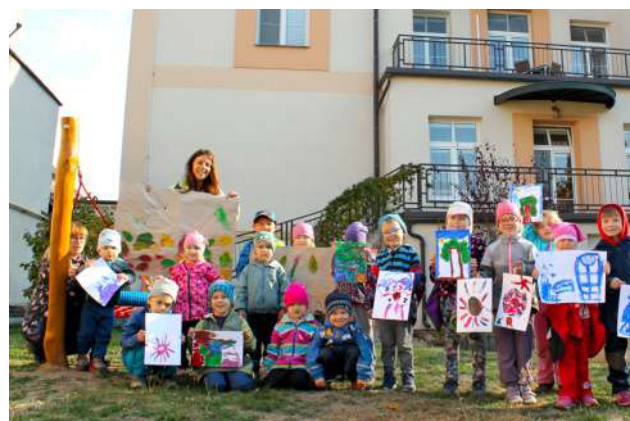
Podzim ve školce Studánka u sv. Jakuba