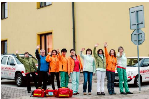
Mobilní hospic Anežky České