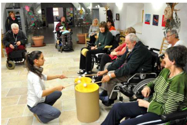
Muzikoterapie v Domově svatého Josefa