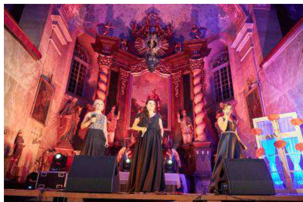
Benefiční koncertní představení Muzikál v kostele.