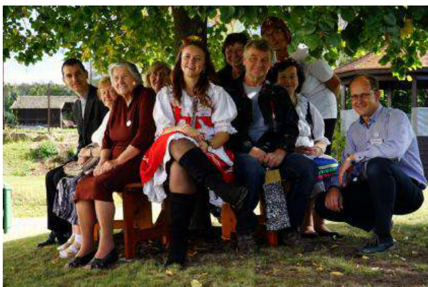
20 let Domu s pečovatelskou službou.