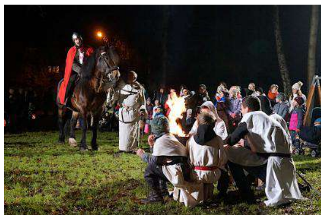
Svatomartinský průvod v Červeném Kostelci.