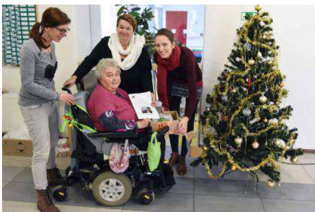
Akce Ježíškova vnoučata v Domově sv. Josefa.