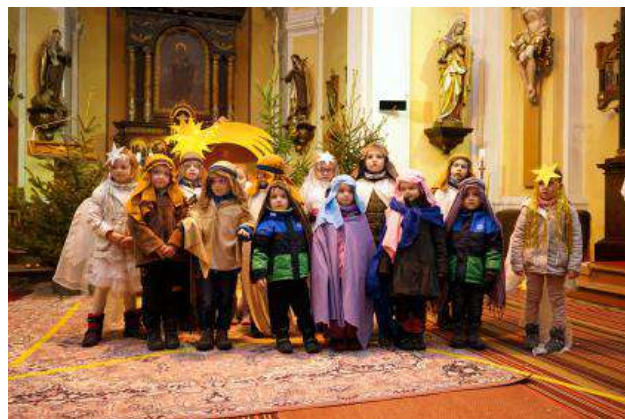
Děti z MŠ Studánka sehrály vánoční představení.