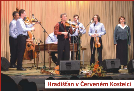
Hradištán v Červeném Kostelci