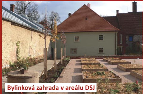
Bylinková zahrada v areálu DSJ

V pokojích pro pacienty bylo vyměněno dvacet plastových balkonových oken na jihozápadní straně budovy hospice. Hospicová kuchyně byla dovybavena elektrickým pojízdným servírovacím vozíkem s vodní lázní. Pro ležící a inkontinentní pacienty byl pořízen potřebný zdravotnický materiál a nezbytné přípravy na vlhké hojení ran a další ošetřování.