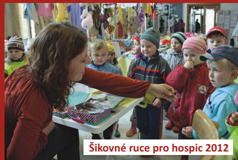
Šikovné ruce pro hospic 2012