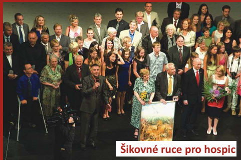
Šikovné ruce pro hospic