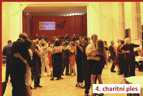
4. charitní ples