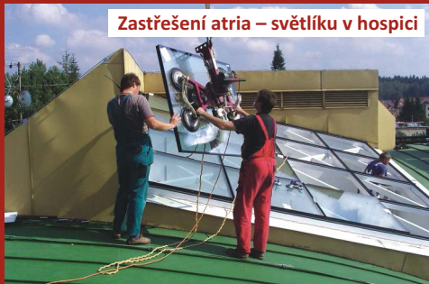
Zastřešení atria – světlíku v hospici