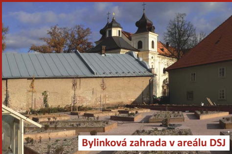
Bylinková zahrada v areálu DSJ