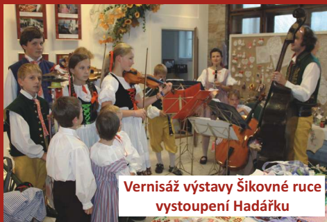
Vernisáž výstavy Šikovné ruce vystoupení Hadáčku