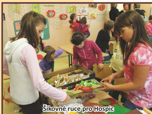
Šikovné ruce pro Hospic

Oblastní charita Červený Kostelec srdečně zve šikovné děti a dospělé k účasti do soutěže, jejíž výtěžek podpoří péči v Hospici Anežky České. Soutěžím o nejnápaditější vlastnoruční výrobek z kategorie oděvy a oděvní doplňky, umělecká díla, bytové doplňky, dětské výrobky a ostatní. Odborná komise vybere z každé kate-