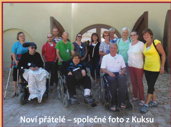
Noví přátelé – společné foto z Kuksu