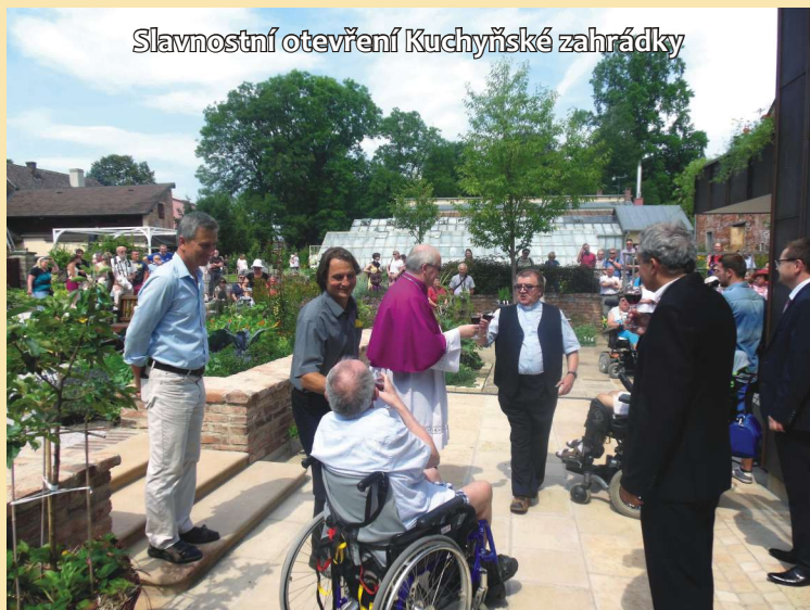
Slavnostní otevření Kuchyňské zahrádky