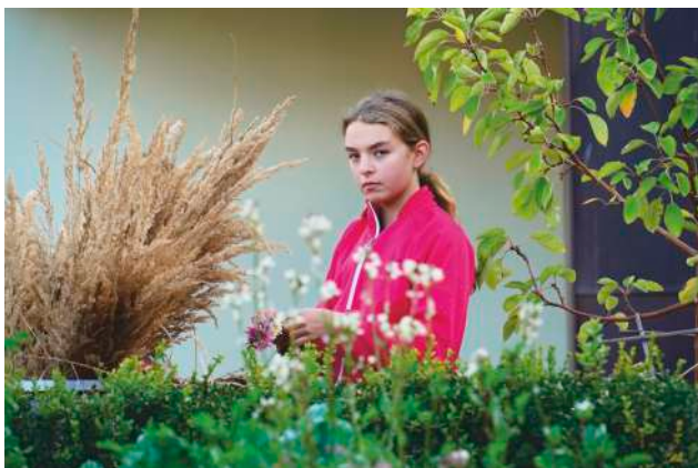
Bylinkobraní v Žirči.