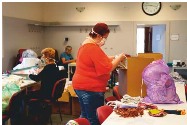
Třídění roušek na Háčku.