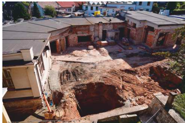
Počátky budování 2. části Centra sv. P. Pia