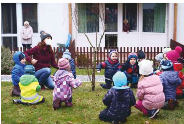
Děti z MŠ Studánka na návštěvě seniorů.