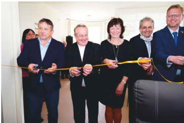
Slavnostní otevření Denního stacionáře