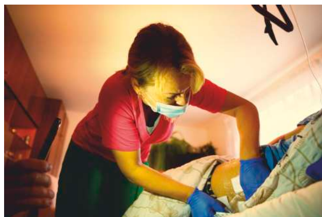
Pacient v péči Mobilního hospice Anežky České.